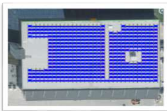
Afbeeldingen van het gebouw van Aktief met bovenaanzicht van het dak met 450 zonnepanelen.